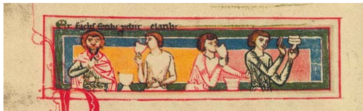
Miniature des quatre buveurs (Carmina burana, f. 89 v)