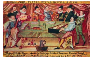
Ensemble instrumentale estudiantine (Bréviaire de Johann Wilhelm Thenn, propriété privée)